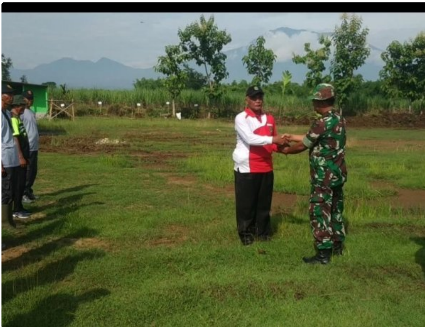
Jaga Kelestarian Alam Kodim 0804/Magetan Tanam 1.950 Bibit Pohon Sukun

Magetan – Sebagai bagian dari upaya menjaga kelestarian lingkungan dan mendukung program penghijauan yang dicanangkan pemerintah, TNI dari Kodim 0804/Magetan bersama pemerintah desa, masyarakat dan pengiat lingkungan