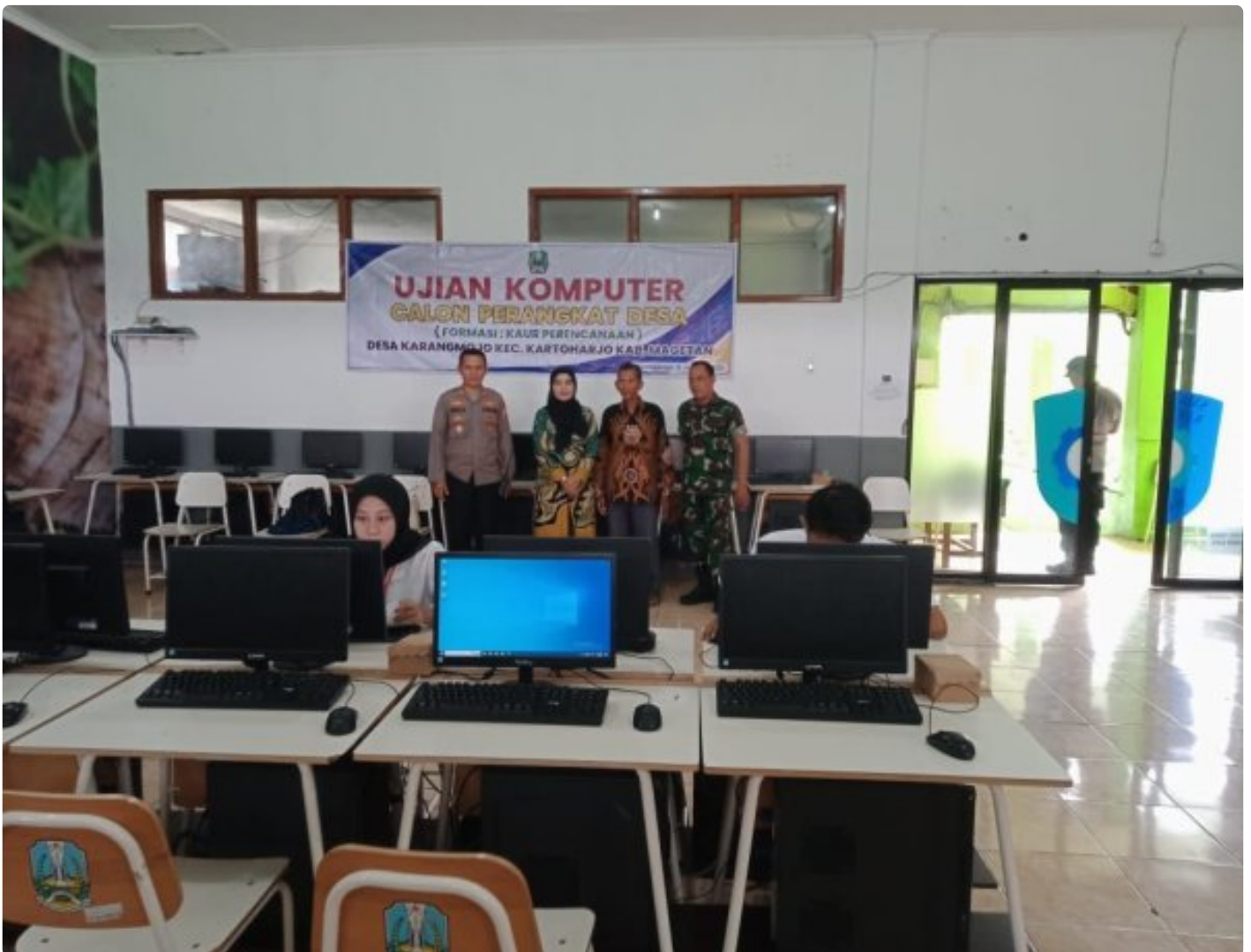
Danramil 0804/08 Barat Hadiri Penjaringan Ujian Praktek Komputer Calon Perangkat Desa Karangmojo

Magetan. – Komandan Koramil (Danramil) Tipe B 0804/08 Barat Kapten Inf