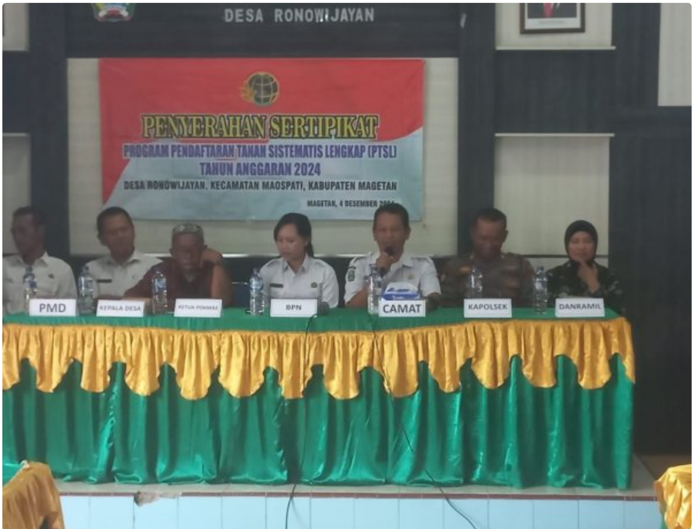
Danramil 0804/06 Maospati Hadiri Penyerahan Sertifikat PTSL Desa Ronowijayan

Magetan. - Bertempat di Balai Desa Ronowijayan, Kecamatan maospati,