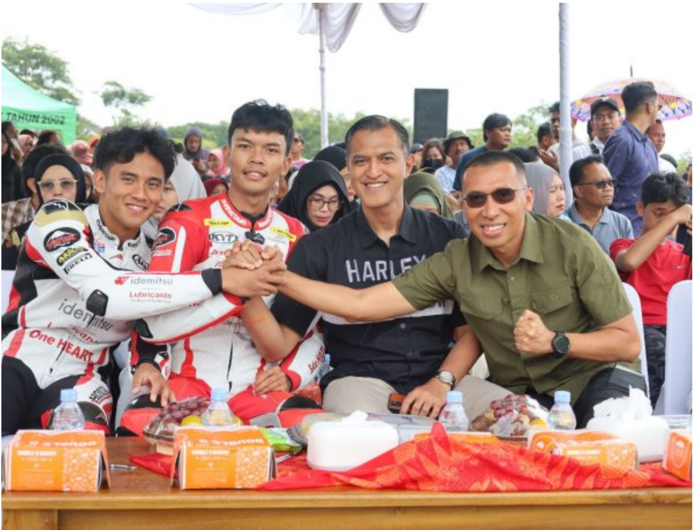
Dandim 0804/Magetan Hadiri Undangan Tinjau Sirkuit Magetan