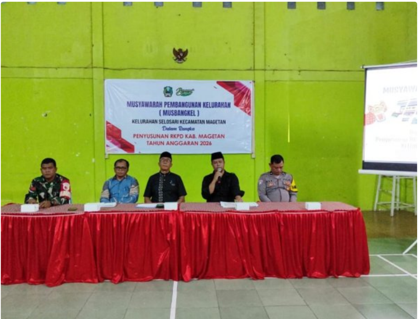
Babinsa Koramil 0804/01 Magetan Hadiri Musyawarah Pembangunan Kelurahan (MUSBANGKEL)

Magetan. - Babinsa kelurahan Selosari Koramil Tipe B 0804/01 Magetan jajaran